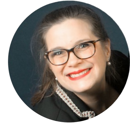
REBECCA JOY LOHNES

soprano sud-coréenne, cache derrière son visage lisse de poupée de porcelaine un tempérament de feu et une virtuosité époustouflante. Parfaitement à l'aise dans les grands registres, sa voix toute en rondeur révèle des ressources insoupçonnées d'énergie. Elle est l'acrobate du groupe !