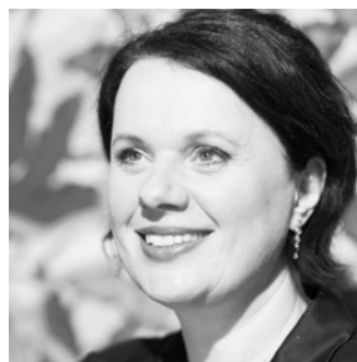
Angela Lösch mezzo-soprano allemande